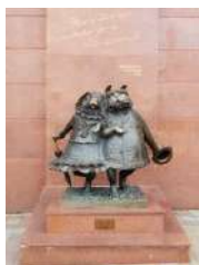
Скульптура «Влюбленным собачкам»

Кубаночка: Посмотрите, ребята, мы с вами стоим возле знаменитого памятника «Влюбленным собачкам». В старинном Екатеринодаре было очень много бродячих собак. Великий поэт В.В. Маяковский однажды посетил Краснодар. И случилось так, что именно здесь на железнодорожном вокзале он был укушен бродячей собакой. Поэта удивило огромное количество собак на улицах города, возможно, это и послужило поводом для рождения известной фразы «Это вам не собачья глушь, а собачкина столица!». С тех времен, с легкой руки поэта, Краснодар и получил статус «собачкиного города» или же «собачкиной столицы».