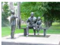
Памятник «Связь поколений»

Кубаночка: недалеко от парка, в котором мы с вами только что были, находится современная скульптурная композиция «Связь поколений». Работа была создана в 2015 году. Ее соорудили рядом со школой. На ней изображен уважаемый ветеран Великой Отечественной войны, рядом заинтересованные дети. Краснодарцы помнят великое героическое прошлое своего города и с уважением относятся к ветеранам. Городская администрация, общественность и ветеранские организации поддерживают патриотическое воспитание подрастающего поколения, наследников Великой победы.