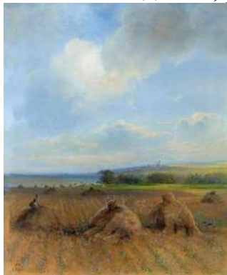
"К концу лета на Волге", 1873 Холст, масло. 55 x 44 см.

Произведение "К концу лета на Волге" написал Алексей Кондратьевич Саврасов. Дата создания полотна 1873 год. Это, ребята, 150 лет назад.