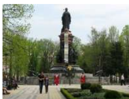
Памятник Екатерине II

Чуть дальше, в Екатерининском сквере находится главный памятник города - скульптура Екатерины II. Здесь очень уютно. Краснодар в целом ухоженный и зеленый город, но Екатерининский сквер какое-то особенное место. В сквере проходят традиционные праздники кубанских казаков. В праздничные дни рядом с памятником Екатерины II стоит караул из казаков в национальных красных нарядах.