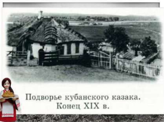
Подворье кубанского казака. Конец XIX в.