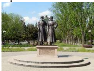
Скульптура сынам Отечества казакам и горцам

В конце Александровской аллеи недавно появился бронзовые фигуры казака и горца (2016 год). Они великолепно смотрятся среди зелени и просторов парковой зоны. Авторы памятника «Славным сынам Отечества казакам и горцам – героям Первой мировой войны» Авторы-скульпторы создали статуи в рост человека.