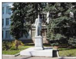
памятник Ломоносову М.В.