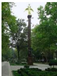
Скульптурная композиция «Добрый Ангел Мира»

Кубаночка: Мы с вами находимся в парке «Городской сад». Парку 176 лет, он издавна был главной достопримечательностью города, в нем много скульптур. Самой культовой стала композиция «Добрый Ангел Мира». Она, как визитная карточка Кубани, на которой представлены местные жители - кубаночка и казачок в национальных костюмах. Маленькие поселенцы говорят о мире и дружбе на Земле. В парке можно гулять весь день, но много других интересных памятников в городе. Продолжим прогулку по главной улице Краснодара.