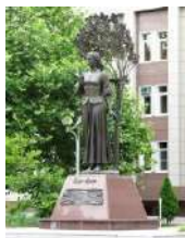
Памятник Кларе Лучко

Кубаночка: Недалеко находится большая гостиница. У входа - памятник актрисе Кларе Лучко. Она стала популярной после роли в фильме «Кубанские казаки».