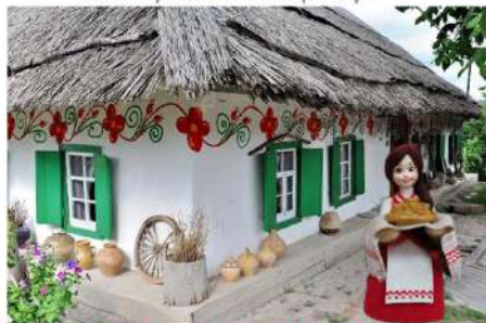
Виртуальная экскурсия «Кубанская хата – всем богата»