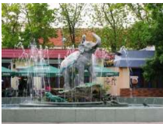
Индийский мальчик на слоне.