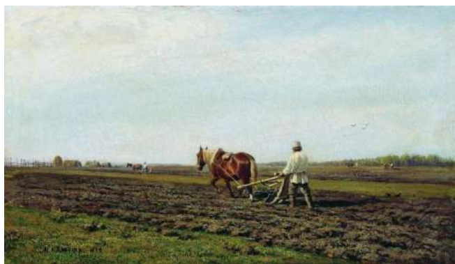
"На пашне", 1872 Холст, масло 27,3 x 47,7 см.

Картина "На пашне" принадлежит кисти Михаила Константиновича Клодта. Работа была создана в 1872 году и показывала собой образ могучей и великой страны.