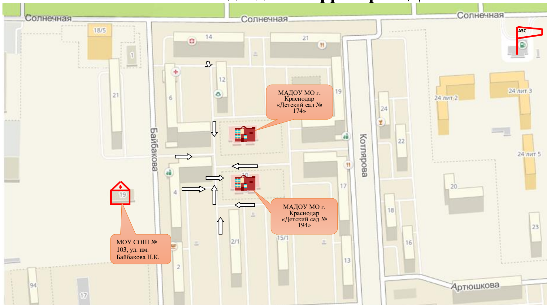
Схема безопасного подхода на территорию ДОО № 194